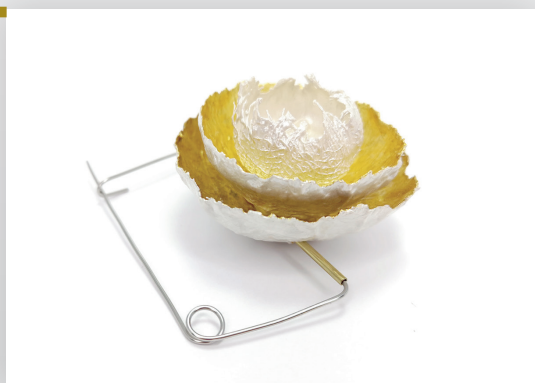
Alexandra Prelipcean Roemenië broche | papier, bladgoud, messing, rvs