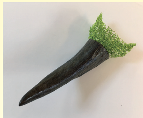
broche koehoorn, metaal draad, 2018