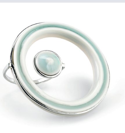
HSC: Judith Bloedjes Dubbelring Limoges porselein, celadon, twee segmenten 2025